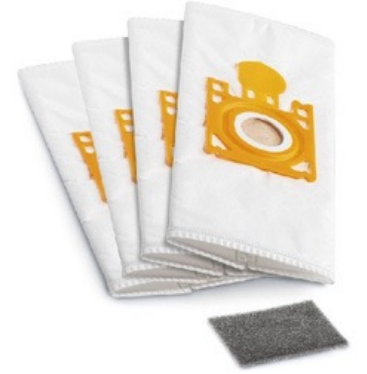
Toz Torbası ÜRÜN KODU : 787252

Diğer tüm detaylar için www.thomasturkiye.com.tr