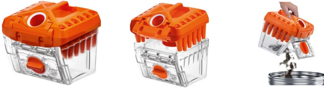
Kuru Süpürme Kovası ÜRÜN KODU : 118138

Diğer tüm detaylar için www.thomasturkiye.com.tr